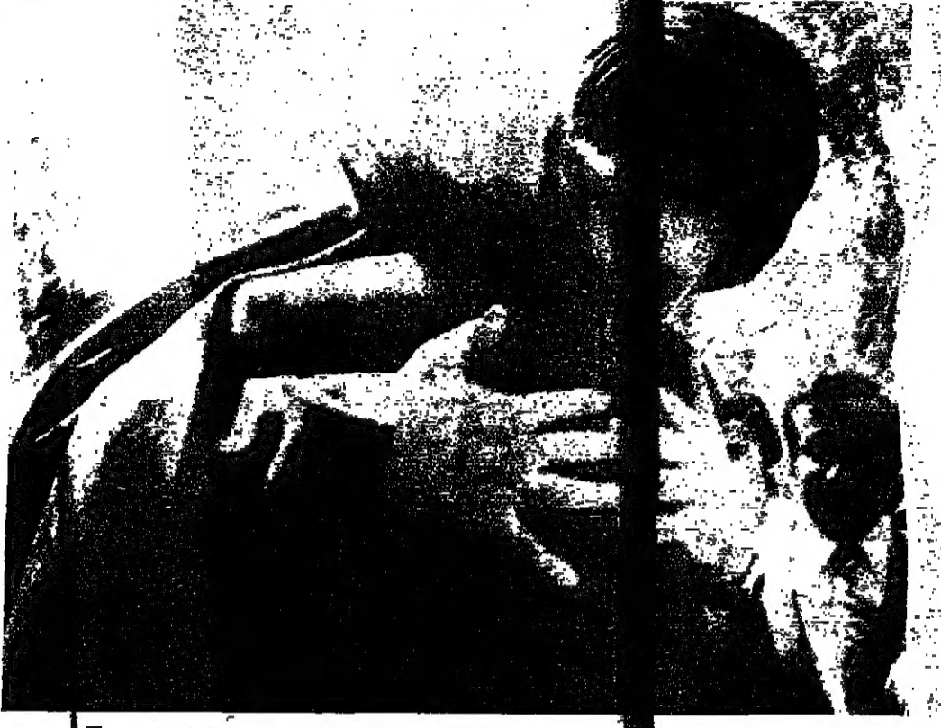
اللقاء بين الرئيس فر بقيادة الأمام الصدر في المجلس الإسلامي الشيعي الأعلى أمس